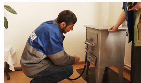
БЕЗОПАСНОСТЬ В ПОДАРОК