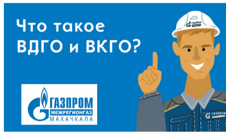
ЧТО ТАКОЕ ВДГО И ВКГО?