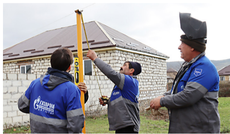
ГАЗУ И ТЕПЛУ В ДОМАХ ДАГЕСТАНЦЕВ – БЫТЬ!