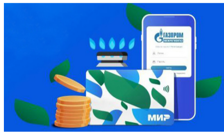
ДАГЕСТАНЦЫ МОГУТ ОПЛАТИТЬ КОММУНАЛЬНЫЕ УСЛУГИ БЕЗ КОМИССИИ ЧЕРЕЗ ОНЛАЙН-СЕРВИСЫ